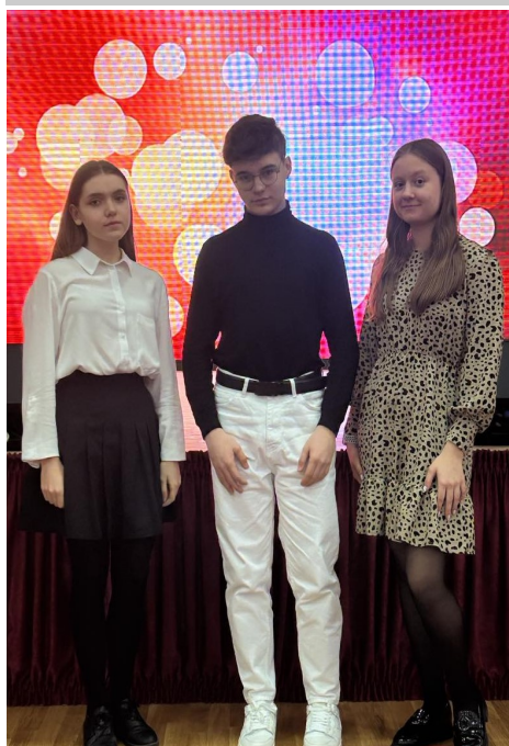
Муниципальный этап областного смот-

ра самодеятельного художественного творчества «Я вхожу в мир искусств», посвященного Году педагога и наставника, прошел среди обучающихся образовательных организаций и учреждений дополнительного образования города Брянска. В Фокинском районе смотр проводился 30 марта на базе МБОУ «Лицей № 27 имени Героя Советского Союза И. Е. Кустова». Этот конкурс принес нашим учащимся отличные результаты! Лауреатами смотра «Я вхожу в мир искусств» стали следующие участники: